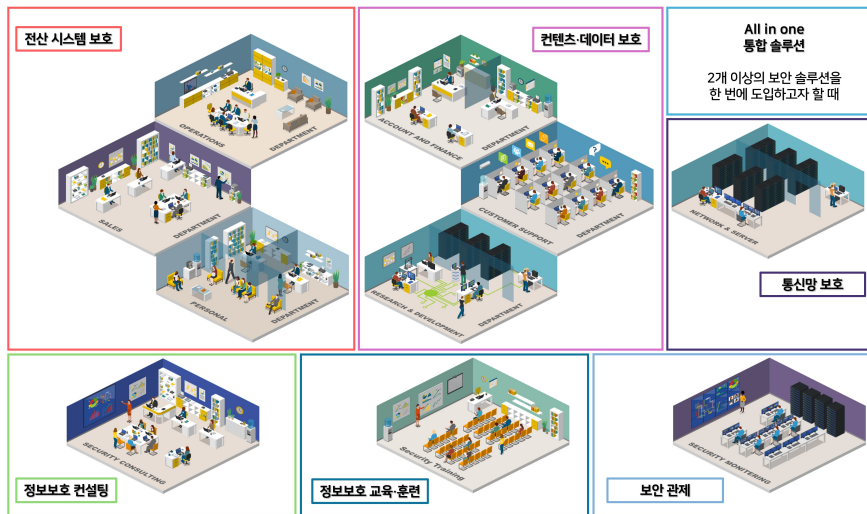
<메인화면 가이드 맵>